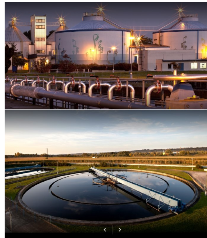
ČOV ČEVAK a.s.

GSM: + 420 601 559 323 + 420 721 315 737 forsapi@forsapi.cz www.forsapi.cz